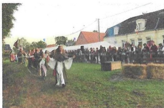
Le spectacle de samedi soir a attiré environ 150 personnes.