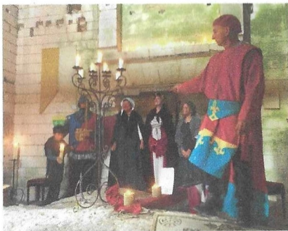
La troupe à l'issue des représentations dans l'église.

Samedi, deux balades ont fait découvrir le patrimoine communal, la grande boucle emmenant vers le château d'Acquembron. Au retour, la soirée d'inspiration médiévale pouvait débuter. Depuis le parking de la mairie, avec en arrière-plan le clocher, quelque 150 personnes ont apprécié le spectacle équestre, chanté, dansé et en costume. Dame Sophie de Meneville d'Hamercourt, cousine de Gérard de Méricourt, abbé de Saint-Bertin et premier évêque, arrive avec les armoiries à cheval, entourée de la troupe composée d'une quinzaine d'enfants et d'adultes.